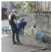
木瀬川自治会の清掃風景