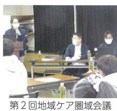
第2回地域ケア圏域会議