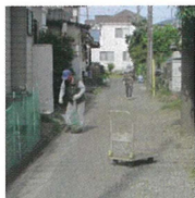
富士町自治会の清掃風景

【日時】令和8年4月19日(日)8時〜 木瀬川自治会と富士町自治会は、隣接し、両地区の一斉清掃は、昔から4月に行われます。今回は、地域住民が協力して市民の共有財産である道路・河川・側溝・公園などの公共スペースの清掃と消毒、清掃を通じて日頃、顔を合わせる事の少ない住民同士が一堂に会する機会となり、顔の見える関係づくりや防災意識の向上に役立ちました。また、奉仕精神の育成・地域貢献を通じて、自分たちの住む場所を守る意識を育み、協力しあい、自分たちの住む地域を清掃することで、地域の一員としての自覚を深め、勤労・社会奉仕の精神を養う機会となりました。街をきれいに保つ活動は、衛生・美化環境の向上、住民間の交流と連帯感の醸成、犯罪の防止力を高め、安全で住みよい環境を作る上で重要。 汚泥は決められた場所に集積され、後日、沼津市が回収。草・ゴミなどは各指定された場所から自治会が回収。一カ所に集められたゴミは協議委員が分別し終了しました。