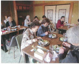
▲懇親会の食事会風景

3月の【きせつ家】では、『刺し子』に挑戦しました。その手始めに、「大人のぬり絵」で、自分にあったデザインを決め、刺し子に備え、今回は、針通りの良い晒(さらし)を2枚重ね、ハンカチサイズで行いました。刺し子(さしこ)は、本来、藍色の布に白い糸で幾何学模様を刺し縫いする、日本に古くから伝わる伝統的な刺繍技法で、16世紀頃の東北地方で、防寒や衣類の補強、耐久性を高めるための生活知恵として生まれました。現在は、ふきん、小物、インテリアなどで、温かみの手仕事として親しまれています。そして、懇親会として食事を開きました。日頃、皆さんで食事をする機会が少ないため、今回、企画しました。会話をしながら楽しいひと時を過ごしました。